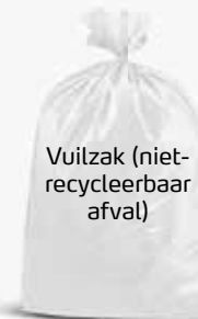
Vuilzak (niet- recycleerbaar afval)