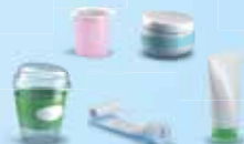
Potjes en tubes