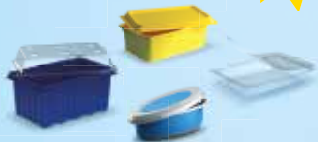
Schaaltjes, vlotjes en bakjes