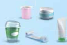
Pots et tubes