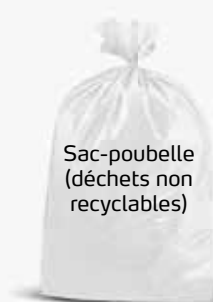
Sac-poubelle (déchets non recyclables)