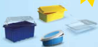
Barquettes et rapiers