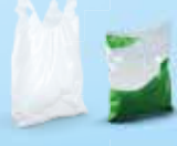
Sacs et sachets